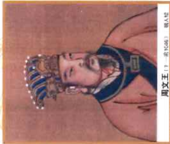
周文王 ( 1100-1050 ) 周人皇